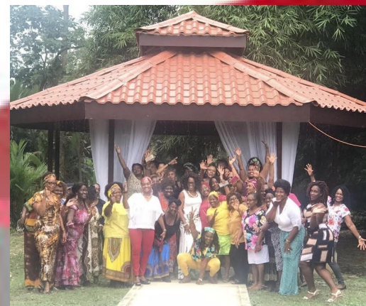
Foto de Archivo. Visita de la VP Epsy Campbell al Foro Nacional de Mujeres Afrodescendientes.