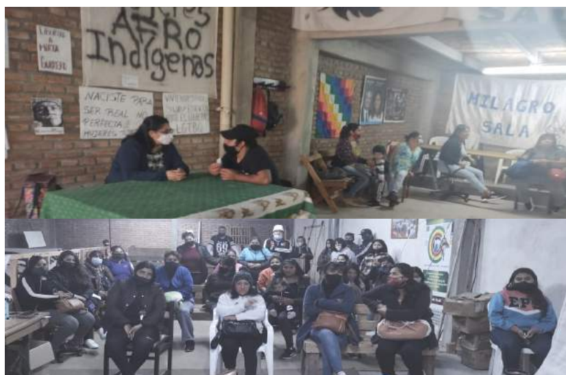
Mujeres afro indígenas del movimiento María Remedios del Valle de la organización Tupac Amaru de la provincia de Salta, recibiendo capacitaciones

Debido a la coyuntura de la pandemia por Covid-19, no se han retomado las reuniones ni mesas de trabajo intersectoriales para el Censo Nacional inicialmente previsto para 2020.