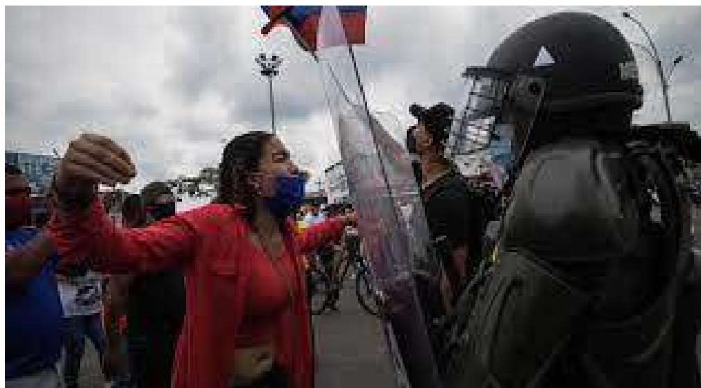
Masacre en Cali en el marco del Paro Nacional.

Continúan desarrollándose las campañas: “Nada justifica la violencia contra las mujeres”, Únete, y “Rompiendo el círculo de violencia. con el lema