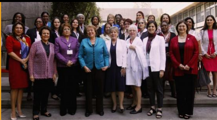
Fotografía de Plenilunia

También pueden consultar el Temario Provisional Anotado y el Temario Provisional .